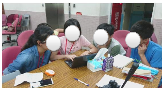
↑孩子們一起腦力激盪，製作成果發表的簡報