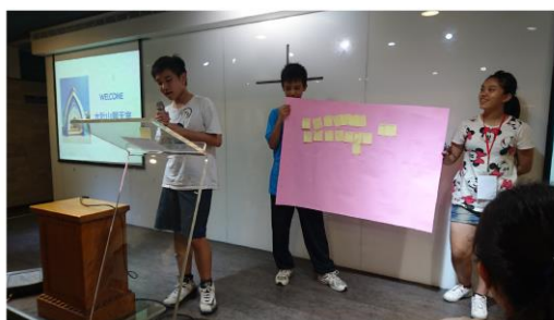
↑「領袖聊天室」學生上台發表看法