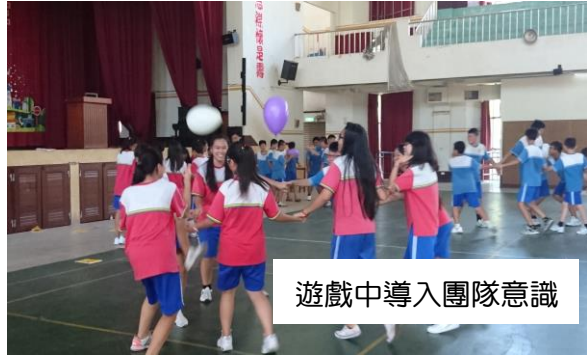
遊戲中導入團隊意識