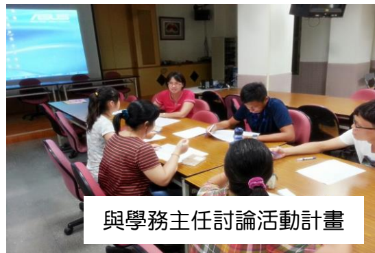
與學務主任討論活動計畫